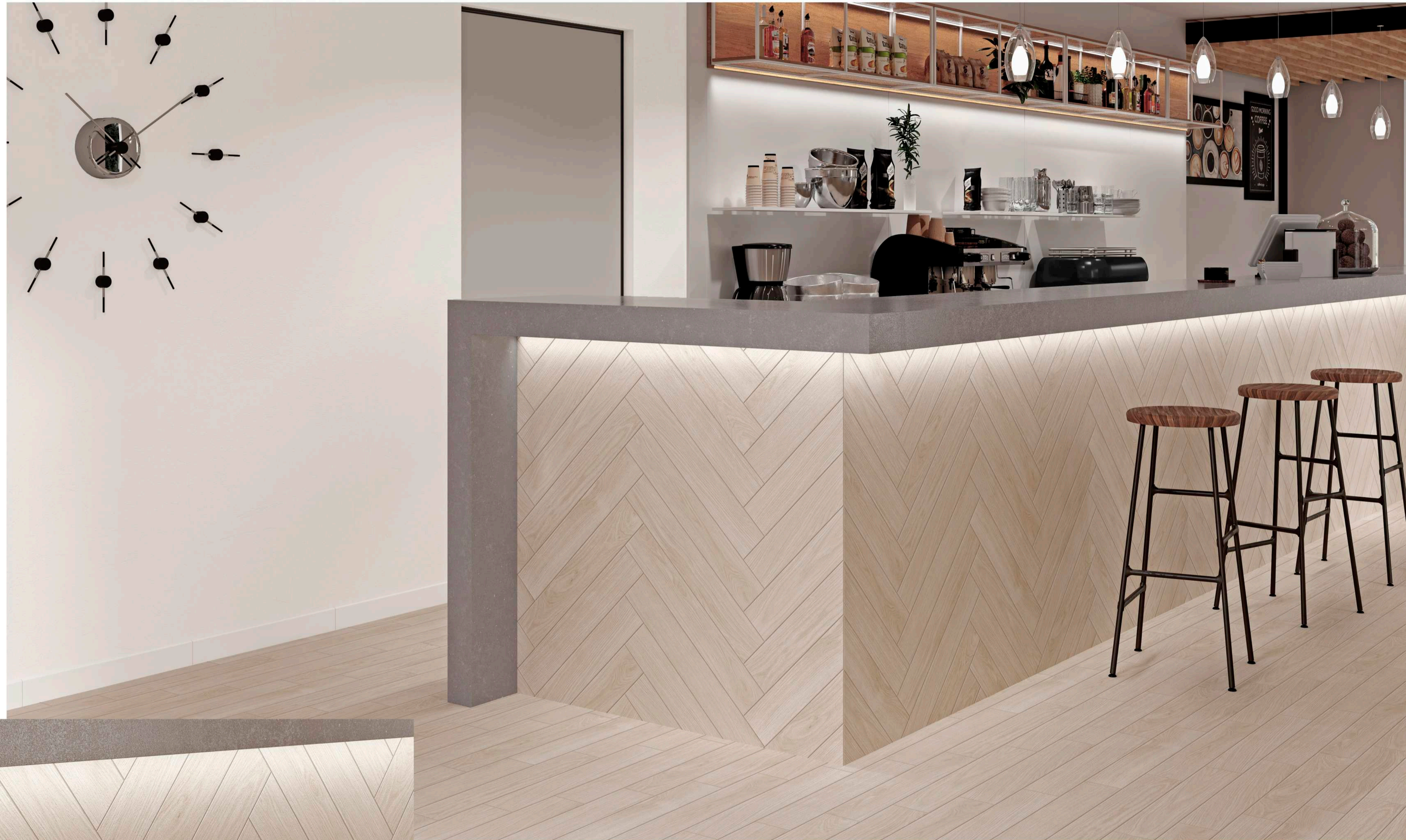
DUCALE BORGIO - 10x60cm / RODAPIÉ BLANCO MATE - 8X60cm