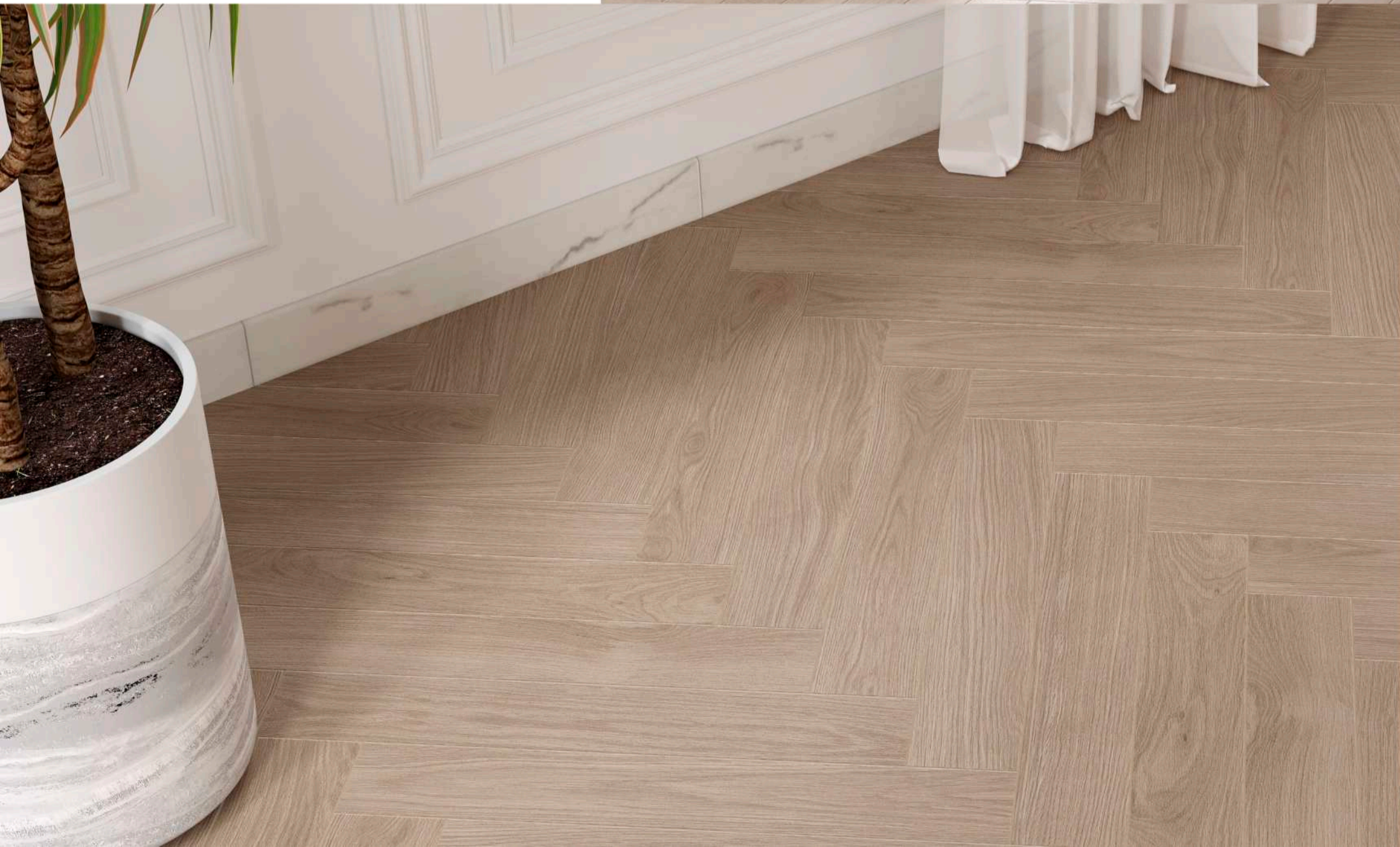
DUCALE ELBUS - 10x60cm / RODAPIÉ MARMOL 1 - 8X60cm