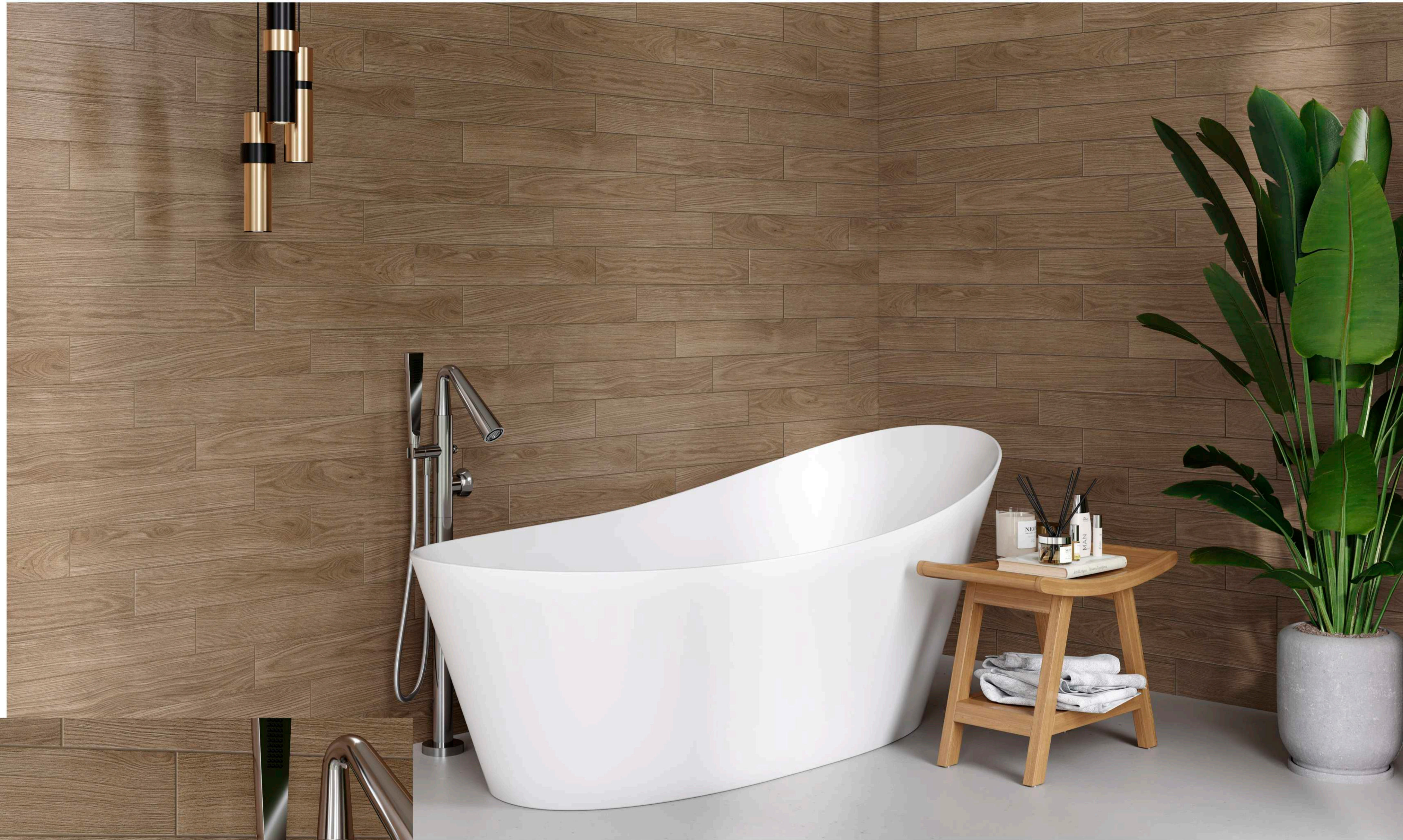
DUCALE ANDINA - 10x60cm