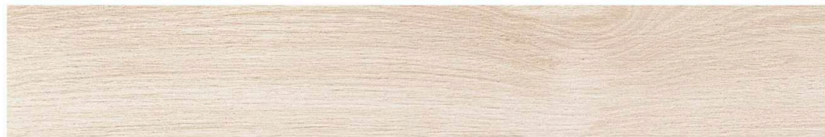
DUCALE BORGIO 10x60 / 4"x24" M-170