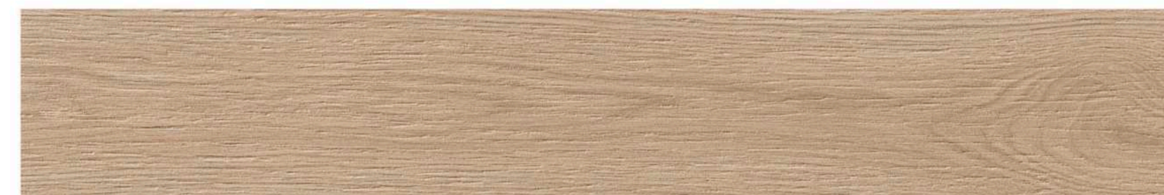
DUCALE ANDINA 10x60 / 4"x24" M-170