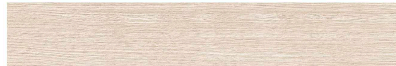
DUCALE ELBRUS 10x60 / 4"x24" M-170