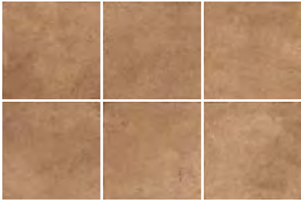
Tobago 15x15 / 6"x6"