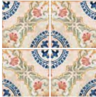
Granadina 15x15 / 6"x6"