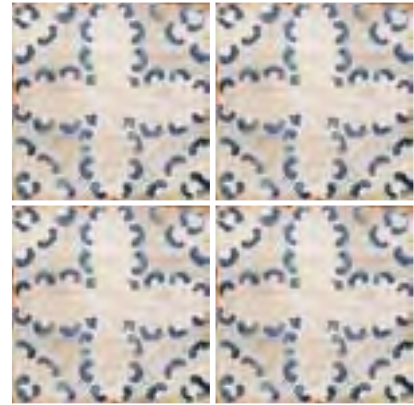
Santa Lucía 15x15 / 6"x6"