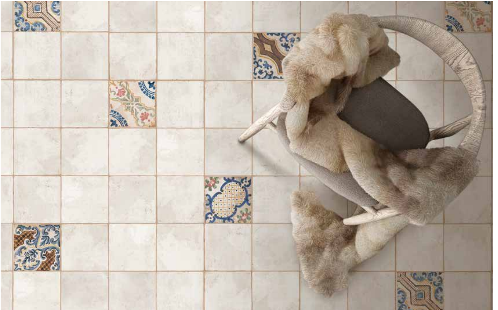
Haití 15x15 | Antillas 15x15 | Bahamas 15x15 | Aruba 15x15 | Granadina 15x15 | Barbados 15x15