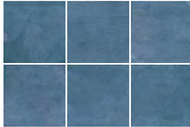
Dominica 15x15 / 6"x6"