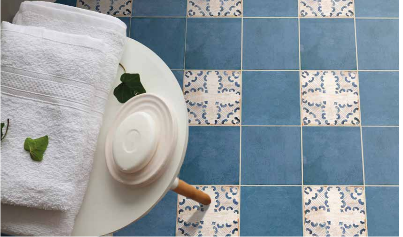
Dominica 15x15 | Santa Lucía 15x15