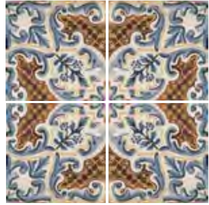
Bahamas 15x15 / 6"x6"