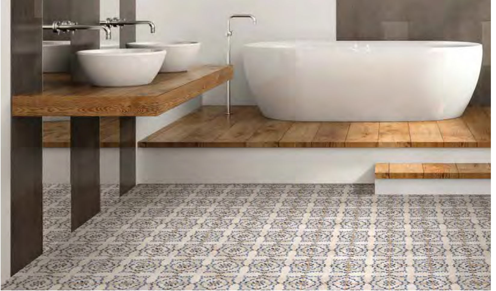
Santa Lucía 15x15