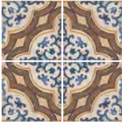
Barbados 15x15 / 6"x6"