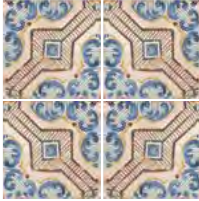
Aruba 15x15 / 6"x6"