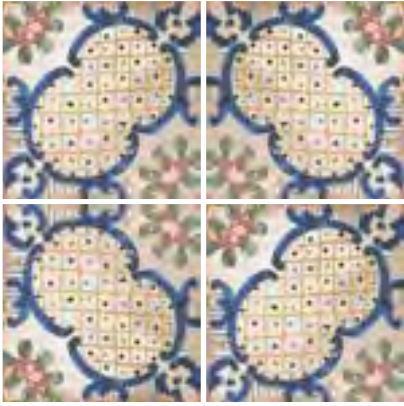
Antillas 15x15 / 6"x6"

PORCELÁNICO PAVIMENTO Y REVESTIMIENTO MATE · 15x15 / 6"x6" FLOOR AND WALL PORCELAIN MATT